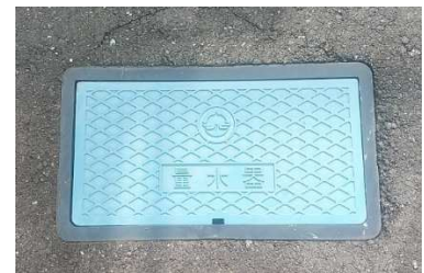
メーターボックス